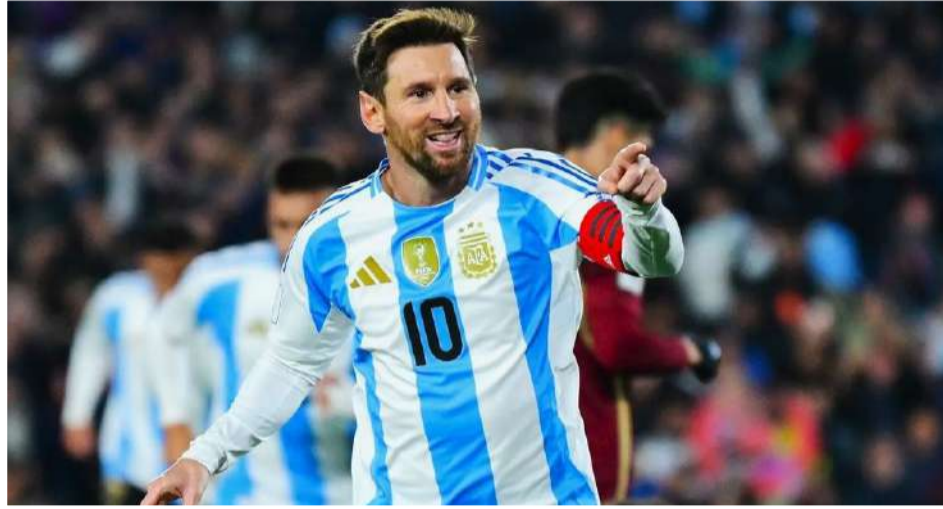
الأمريكي وأعلن نادي إنتر ميامي رسمياً أن فترة تعافيه «ميسي» كما تم التأكد من مشاركة الحارس إيميليانو مارتينيز في

وكان من بينهم النجم الأرجنتيني ليونيل ميسي البالغ من العمر 39 عاماً، الذي يعاني من إجهاد عضلي وشد في أوتار الركبة اليسرى حالياً، لا سيما بعدما منعه الإصابة من إكمال مباراة فريقه إنتر ميامي يوم الأحد الماضي بالدوري