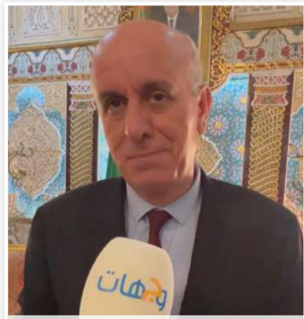
والي تلمسان يتحدث لـ جريدة وجهات