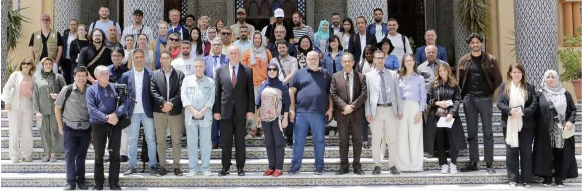
خلال استقباله الوفد الصحفي الدولي الذي يزور الجزائر