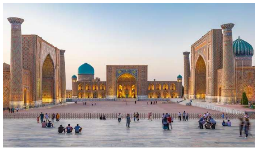
بخارى.. المدينة المقدسة في قلب آسيا الوسطى

مع تزايد الإقبال السياحي على أوزبكستان، أصبح من المهم التركيز على السياحة المستدامة لحماية التراث الطبيعي والثقافي. تسهم السياحة المستدامة في دعم المجتمعات المحلية والحفاظ على المواقع التاريخية تشجيع المشاريع الصغيرة والمتوسطة في سمرقند وبخارى يُعد جزءاً أساسياً من استراتيجية التنمية السياحية المستدامة. تشمل هذه البرامج ورش العمل التي تخصص للسكان المحليين لتعليمهم الحرف التقليدية مثل صناعة السجاد والخزف. تقيد التقارير بأن هذه المشاريع نجحت في زيادة دخل الأسر المحلية بنسبة 25% خلال السنوات الأخيرة. تجسد مدينتي سمرقند وبخارى، أكثر من مجرد مواقع سياحية، إنها تمثل روح آسيا الوسطى بتراثها الثقافي والتاريخي، مع الاستمرار في تسليط الضوء على هذه المدن، يمكننا فهم جمالها المخفي بعيداً عن الصور النمطية، مما يجعلها وجهة لا تنسى لكل من يبحث عن معاني أعمق أثناء السفر.