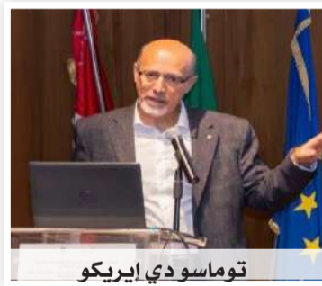
توماسو دي إيريكو

مستوطنة متكاملة تضم مباني سكنية ومدافن دائرية مشيدة بإتقان من الحجارة المشذبة، إضافة إلى أبراج دائرية ضخمة بقطر (20) متراً، مما يعكس تطوراً هندسياً فريداً ودوراً ثقافياً مركزياً للموقع في شمال سلطنة عُمان وسهل الباطنة قديماً. وأبرزت المكتشفات الأثرية، من لقي وفخاريات، عمق الروابط التجارية التي جمعت سكان المستوطنة بحضارات بلاد الرافدين ووادي السند (هارابا)، كما كشفت بقايا الأفران عن اقتصاد حيوي قام على إنتاج النحاس وصهره. وتؤكد هذه المعطيات مكانة الموقع كمركز حضاري واقتصادي عالمي في العصر البرونزي المبكر. وتأتي إقامة هذه الفعالية ضمن برنامج التعليم المستمر الذي ينفذه مركز التعلم بالمتحف الوطني والذي يهدف إلى تعزيز الوعي الثقافي بعُمان، وبناء جسور التواصل مع مختلف المؤسسات الثقافية على المستويين الإقليمي والدولي.