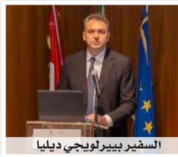
السفير بيير لويجي ديليا