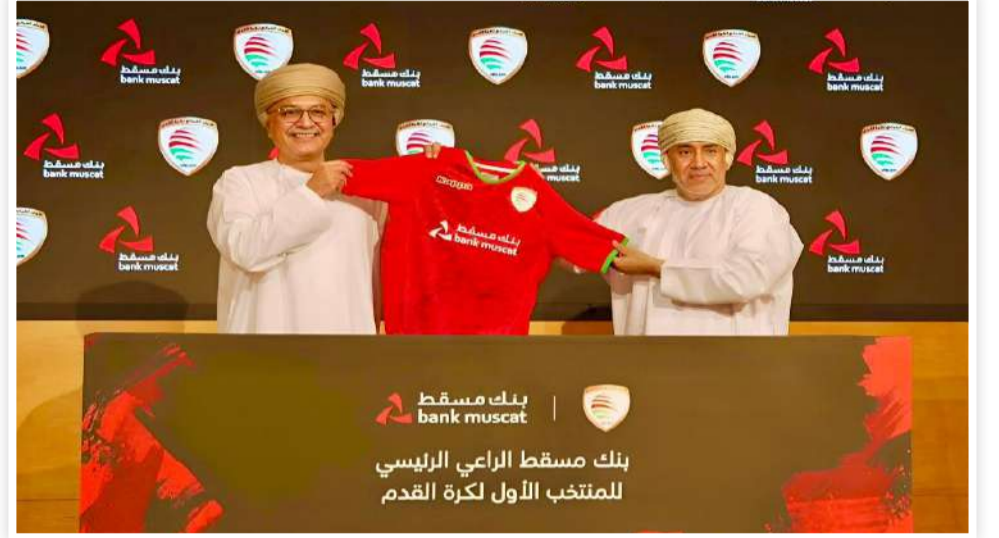
بنك مسقط bank muscat بنك مسقط الزراعي الريسي للمنتخب الأول لكرة القدم