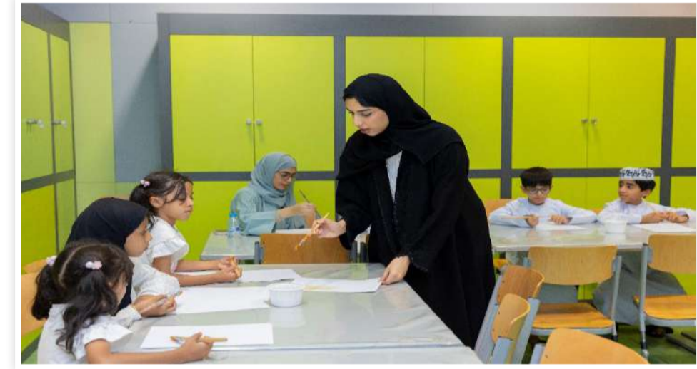
والكليات للمشاركة في تنفيذ البرنامج، بالتعاون مع فريق مركز التعلم بالمتحف، بما يسهم في تنمية خبراتهم العملية

يأتي تنفيذ البرنامج ضمن سلسلة من البرامج والدورات التدريبية التي ينظمها المركز في المتحف الوطني بدعم من شركة «بي.بي. عمان» لتحقيق رسالته التعليمية، والثقافية، والإنسانية.