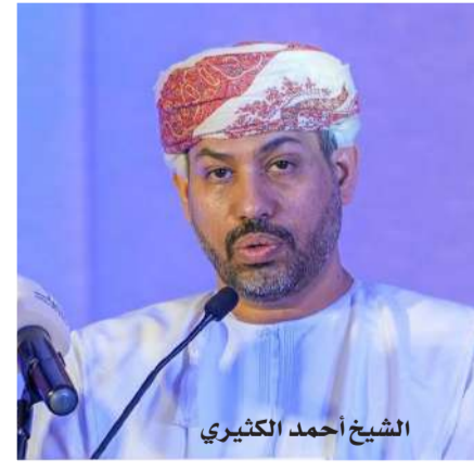
الشيخ أحمد الخثيري

على خارطة السياحة في سلطنة عمان، كما استعرض اللقاء عدداً من المشروعات في قطاعات الثروة السمكية والحيوانية والزراعية والمائية وتشمل مشروعات الاستزراع السمكي في ولايتي الدقم ومحوت بتكلفة 503.5 مليون ريال عماني، ومشروع استزراع السربيان وخيار البحر بولاية محوت بتكلفة 1.6 مليون ريال عماني، إضافة إلى مصانع الثلج في مختلف ولايات المحافظة بتكلفة 61.9 مليون ريال عماني.