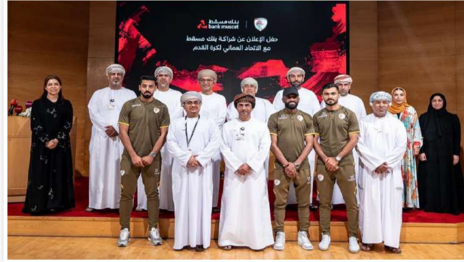
بنك مسقط bank muscat بنك مسقط الزراعي الريسي للمنتخب الأول لكرة القدم