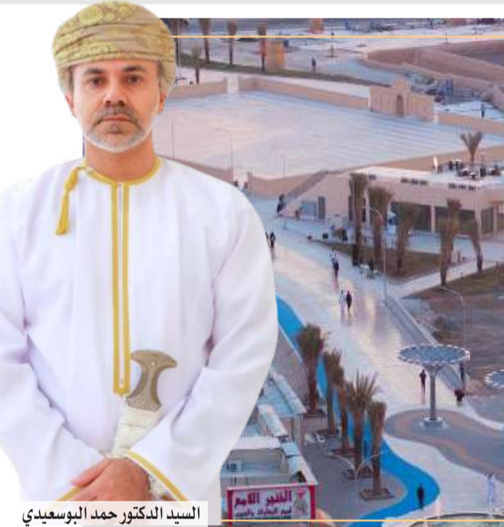
السيد الدكتور حمد البوسعيدي

إلى السائح؛ فكلمة كانت حقوقه وواجباته واضحة، والبيات الشكاوى فعالة، ومعايير الجودة محددة، ارتفعت مستويات الرضا، وتحولت التجربة الإيجابية إلى أداة تسويق عالمية مؤثرة. ومع ما تشهده سلطنة عُمان من مشروعات سياحية وأعادة وتوسع في البنية الأساسية، فإن الفرصة مواتية لمراجعة التشريعات، لتصبح أكثر تكاملاً ومرونة، وتمنح مساحة أوسع للابتكار، مع المحافظة على التوازن الوطني والخصوصية الثقافية. إن صناعة السياحة لا تقوم على المنشآت وحدها، بل تقوم على منظومة تشريعية ذكية، وإجراءات كفؤة، ومؤسسات تعمل بروح الشراكة، ورؤية تنظر إلى السياحة بوصفها صناعة وطنية متكاملة قادرة على جذب الاستثمار، وتشجيع الاقتصاد، وتعزيز المكانة الدولية لسلطنة عُمان.