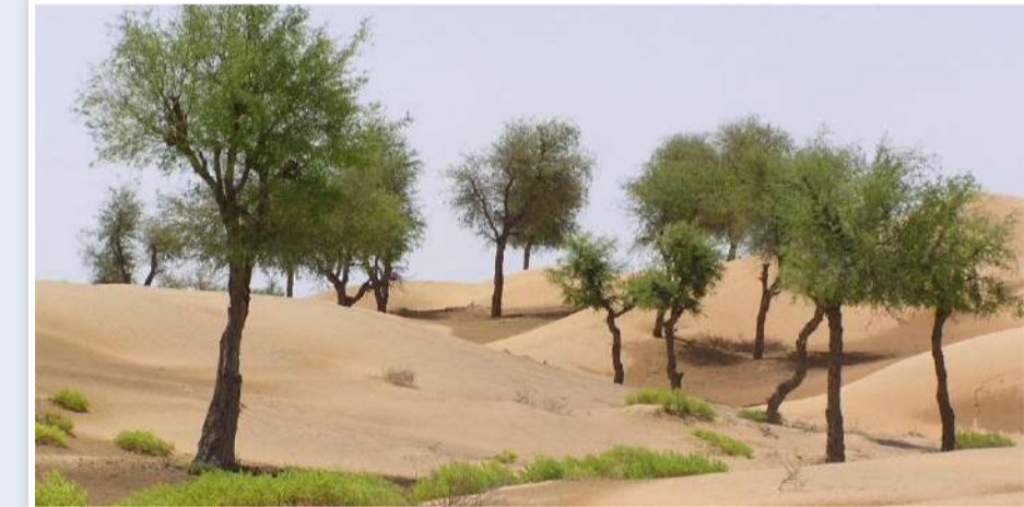
وفي إطار تعزيز التعاون الدولي لمواجهة التصحر والجفاف، تقود

وأوضح المركز أن جميع دول مجلس التعاون صادقت على اتفاقية الأمم المتحدة لمكافحة التصحر خلال الفترة بين عامي 1996 و1999. ما يعكس اهتماماً مبكراً بمعالجة تحديات تدهور الأراضي والجفاف وتعزيز الإدارة المستدامة للموارد الطبيعية. ويتبن المركز أن عدد منظمات المجتمع المدني الممتدة لدى اتفاقية الأمم المتحدة لمكافحة التصحر في دول المجلس بلغ 14 منظمة، تمثل رافداً مهماً للجهود الحكومية من خلال دعم المبادرات البيئية، وتعزيز الوعي المجتمعي، والمساهمة في حماية الموارد الطبيعية واستدامتها. وأشار المركز إلى أن دول مجلس التعاون تولي المراعي أهمية خاصة باعتبارها أحد الموارد الطبيعية الحيوية الداعمة للأمن الغذائي، والحفاظ على التنوع الأحيائي، حيث تطبق الدول الأعضاء أنظمة وطنية