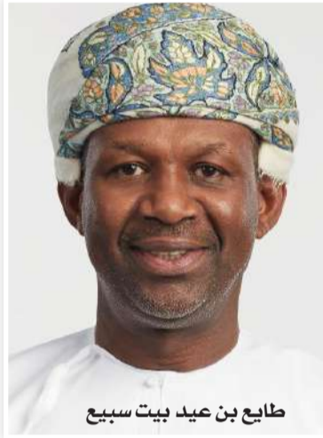
طابع بن عيد بيت سبيع

والمحافل الوطنية الهامة. ويمتلك بنك مسقط شبكة فروع في محافظة ظفار تبلغ 13 فرعاً و 3 مراكز خدمة حسابي موزعة حسب الكثافة السكانية والنمو الاقتصادي والتجاري، في حين تمتد شبكته على مستوى السلطنة لتشمل 200 فرعاً (تتضمن فروع الخدمات المصرفية للأفراد والشركات وميثاق إضافة جهازاً إلكترونياً لتقديم خدمات الصرف والإيداع النقدي وتقديم خدمات مختلفة على مدار الساعة لكافة شرائح المجتمع، مع وجود قنوات للتواصل مع زبائن البنك مثل مركز الاتصالات الذي يعمل خلال 24 ساعة وعلى مدار أيام الأسبوع وغيرها من قنوات التواصل الاجتماعي وذلك لتقديم أفضل الخدمات المصرفية للزبائن وزوار خريف ظفار. ويحرص البنك خلال الموسم على تزويد جميع الزوار ببقاوة متكاملة من الخدمات المصرفية، إذ يمكن لزوار خريف ظفار الاستفادة من الخدمات المتاحة عبر الفروع المنتشرة في ولايات المحافظة، أو أجهزة الصراف الآلي وأجهزة الإيداع النقدي المنتشرة في المواقع الرئيسية بصلافة وخارجها، إلى جانب الخدمات المصرفية الإلكترونية عبر تطبيق بنك مسقط على الهاتف النقال الذي يتيح إجراء جميع المعاملات المصرفية في أي وقت ومن أي مكان.