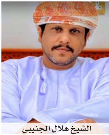
الشيخ هلال الجنيبي

ويرى عدد من الأهالي والمهتمين بالشأن السياحي، أن ما تتمتع به رأس صوقرة من مقومات طبيعية استثنائية تجمع بين الجبال والشواطئ المفتوحة والإطلالات الساحرة على بحر العرب، يؤهلها لاحتضان مشروع متكامل للتخييم والسياحة الطبيعية، بما يعزز من جاذبية المنطقة ويضيف منتجاً سياحياً جديداً إلى محافظة الوسطى، ويساهم في دعم الحركة الاقتصادية والاستثمارية المرتبطة بالقطاع السياحي.