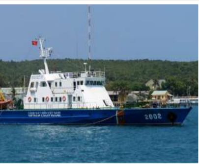
وأضافت السفارة في بيان، السلطات ما زالت تعمل على التحقق من التفاصيل الدقيقة للواقعة، في وقت تتواصل فيه عمليات البحث والإنقاذ، ووصفت ما جرى بأنه، «مأساوي».

وقالت السفارة الهندية في فيتنام إنها تتابع الواقعة عن كثب، وأنشأت مراكز استجابة طارئة في مدينتي هو تشي منه وهانوي لتقديم المساعدة للأسر المتضررة.